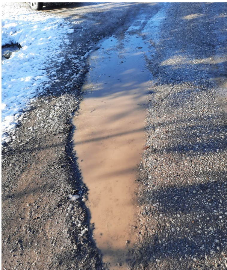
Fotografija 4 - Stacionaža 0+310,00 – 0+385,00 km - detalj