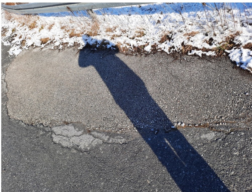
Fotografija 6 - Stacionaža 1+750,00 – 1+780,00 km - detalj