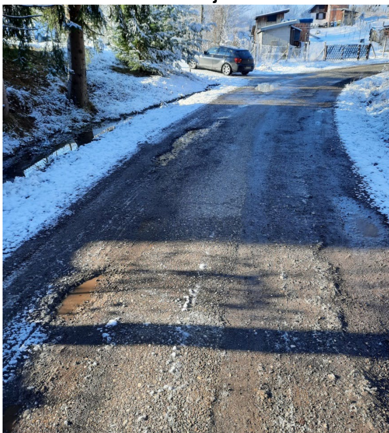
Fotografija 3 – Stacionaža 0+310,00 – 0+385,00 km