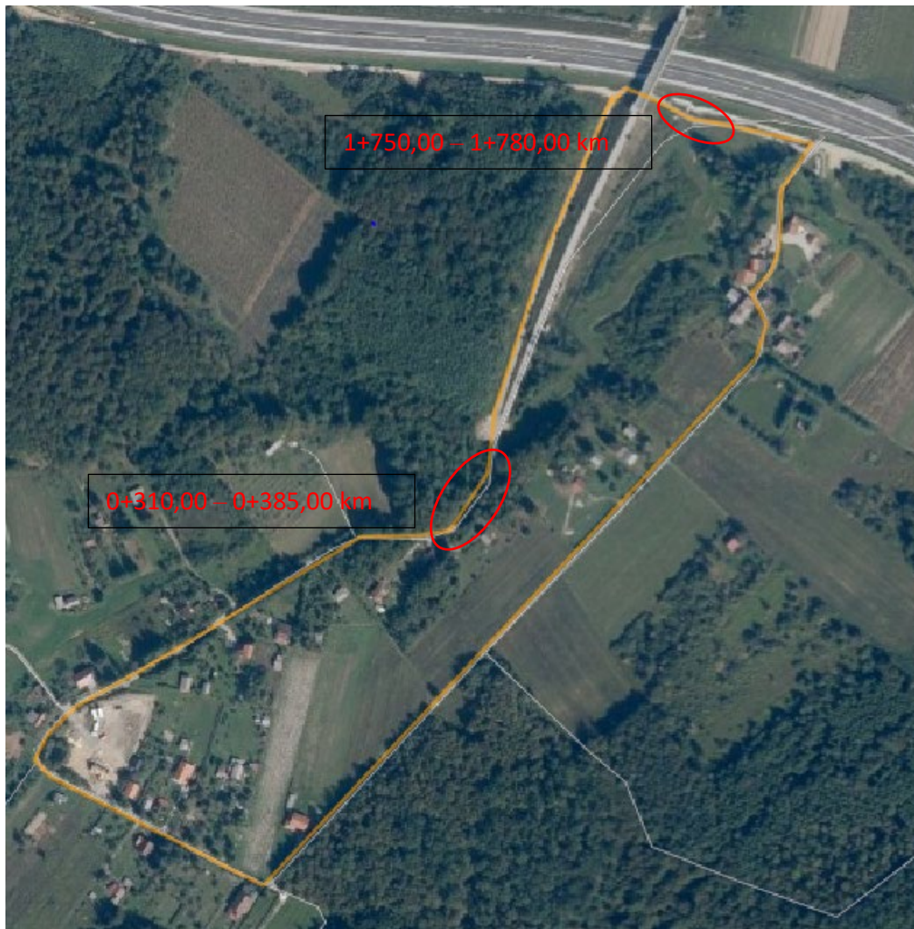
Fotografija 2 - Pregledna karta oštećenja

Na nerazvrstanoj cesti Donji Vukojevac – Plantarićev put od stacionaže 0+310,00 – 0+385,00 km (početak stacionaže 0+000,00 km je na međi kč. br. 2166, uz autocestu Zagreb – Sisak), zatim na stacionaži 1+750,00 – 1+780,00 km, dana 28.02.2022. obavljen je pregled odabranih lokacija. Obilazak predmetnih lokacija – dionica sastojao se od pregleda nastalih oštećenja na prometnici, opisom relevantnih činjenica predmetnih lokacija, te fotodokumentiranjem uočenih oštećenja.