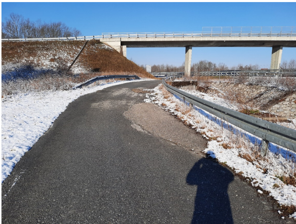
Fotografija 5 - Stacionaža 1+750,00 – 1+780,00 km